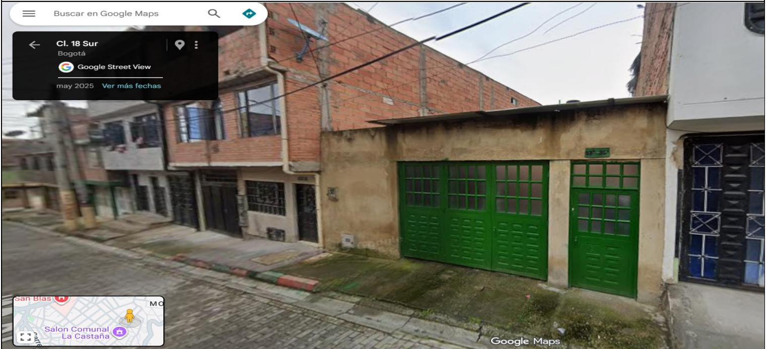
IMAGEN 1: NOMENCLATURA