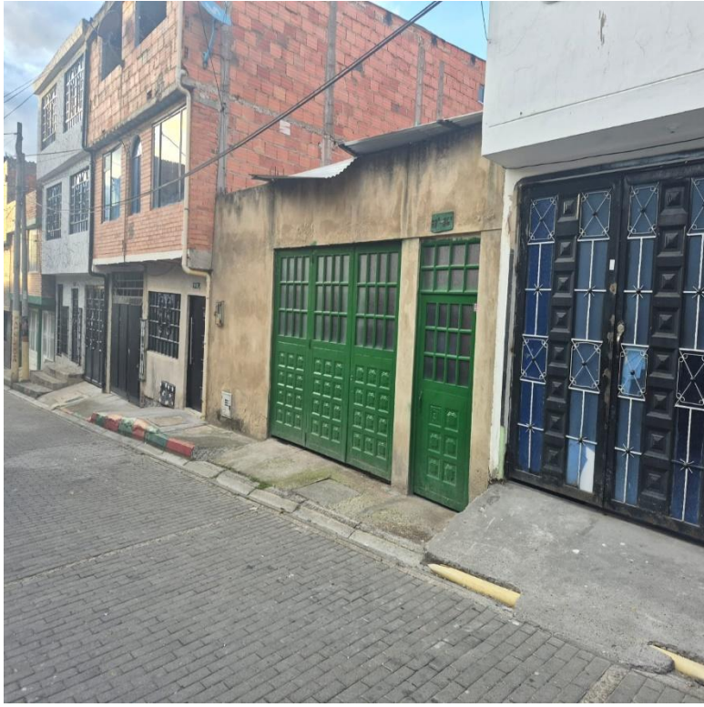
IMAGEN 3: FACHADA LATERAL